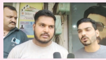
लूट की घटना से खौफजदा आसपास के दुकानदार रोष जताते हुए।